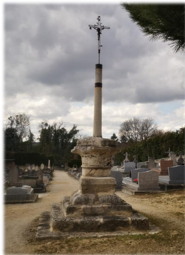
D'après Mme Mabire La Caille, maître de conférences à la Sorbonne et spécialiste du Moyen-Âge, "le chapiteau constituant la base de la croix serait le réemploi d'une partie d'une colonne Gallo-romaine".

Une croix de fer fixée sur une colonne de pierre reposant sur un chapiteau en pierre provenant de l'abbaye de Villiers était à l'origine au milieu du cimetière primitif, entre l'entrée de l'église Notre Dame et la maison des 2 marquises (voir le plan en p. 2). Suite aux travaux de percement de la rue Notre Dame, cette croix fut déplacée devant la sacristie (1841). En 1930, elle fut installée dans l'allée centrale du nouveau cimetière, pour laisser la place au monument aux morts des guerres 1914/1918 puis 1939/1945, représentant un lion de pierre sculpté par Maximilien Fiot.