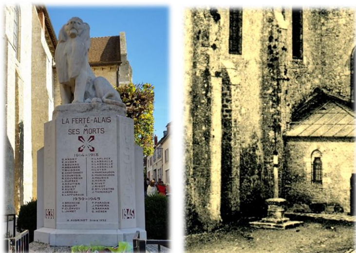
Ci-dessus à droite, la croix en fer installée devant la sacristie de l'église, remplacée en 1930 par le monument aux morts.